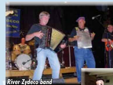
River Zydeco band